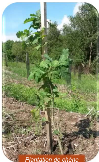
Plantation de chêne

Reboisement après exploitation d'une forêt mûre ou déperissante