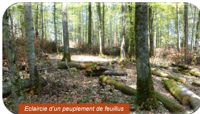
Eclaircie d'un peuplement de feuillus