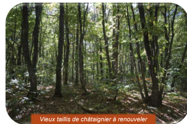
Vieux taillis de châtaignier à renouveler

Vous pouvez donc bénéficier jusqu'à 3400 € d'aides pour renouveler vos taillis de châtaignier vieillis !