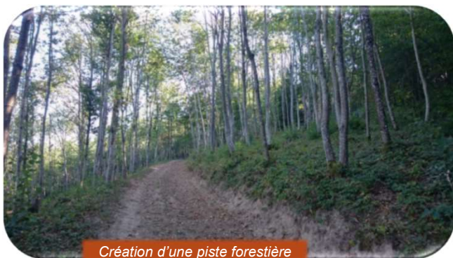
Création d'une piste forestière

Le montant des aides par chantier ne pourra pas excéder un total de 1 500 € et de 80% du montant HT de la facture acquittée.