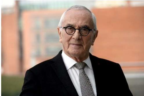
Martin Malvy, président de Sites & Cités, ancien ministre

L'association Sites et Cités Remarquables de France réunit plus 270 territoires membres – soit 1800 communes et 14 millions d'habitants, porteurs d'un site patrimonial remarquable, et mettant en place des politiques de sensibilisation et de concertation des publics au travers notamment de la convention « Villes et Pays d'Art et d'Histoire ».