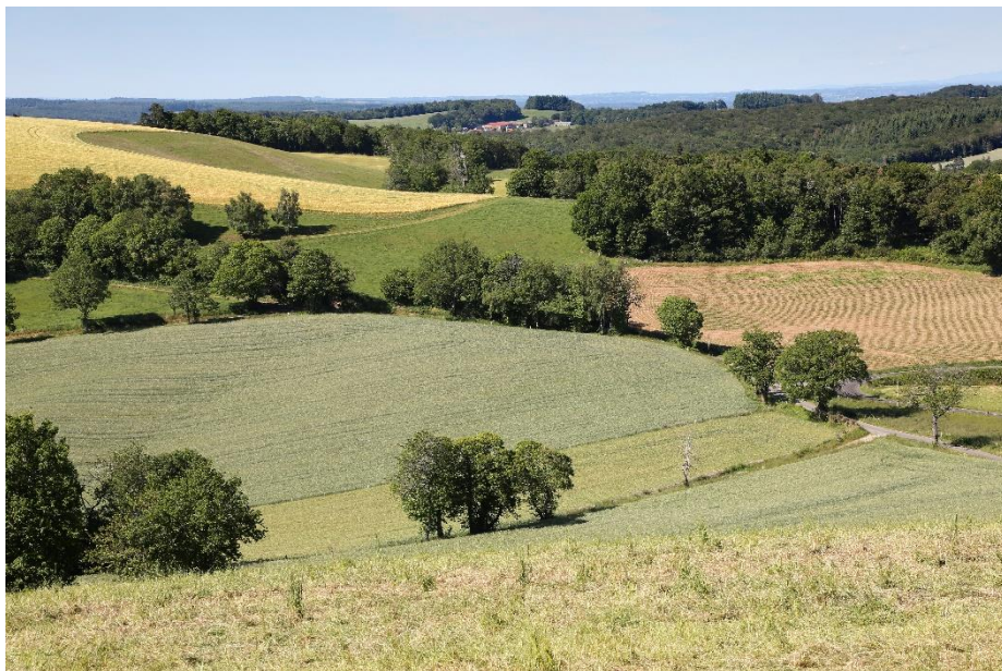
Labastide-du-Haut-Mont, vue paysagère