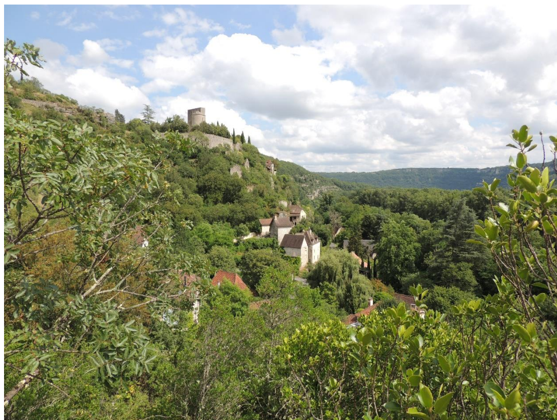
Montbrun, vue du village et du château

Les visites de village du Pays d'art et d'histoire du Grand-Figeac, vallées du Lot et du Célé Octobre 2023 – Juin 2024