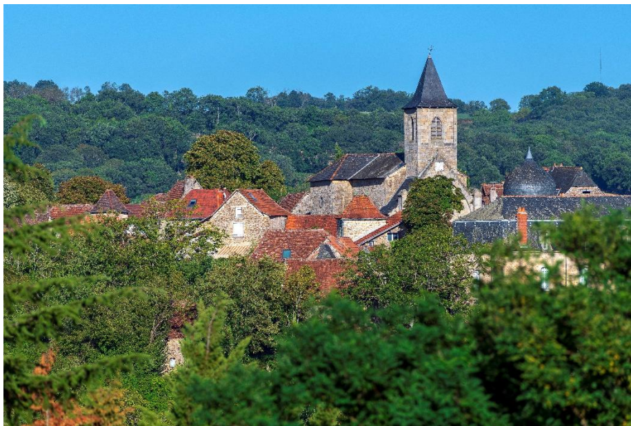
Les toits de Loupiac (Causse-et-Diège)