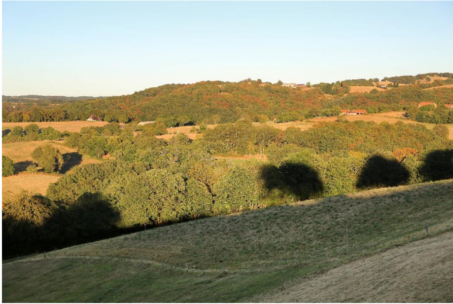
Labathude, vue paysagère