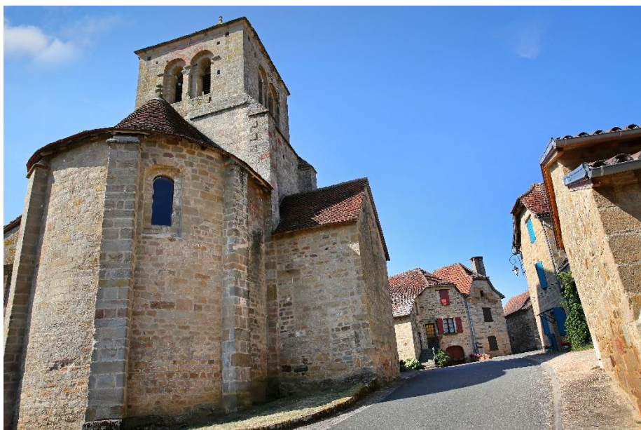
Le Bouyssou, vue du cœur du village, depuis le chevet de l'église Sainte-Croix