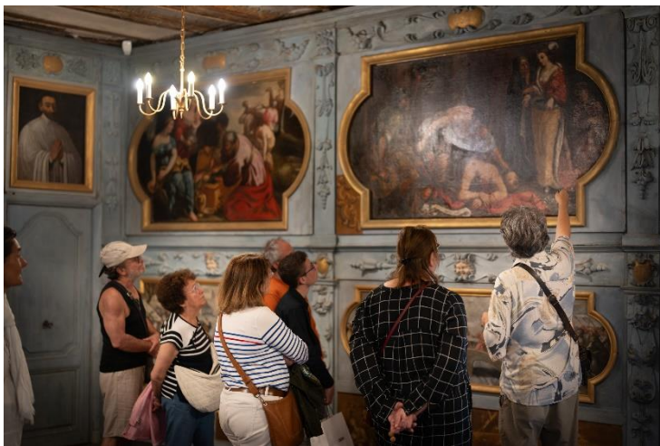
Visite guidée