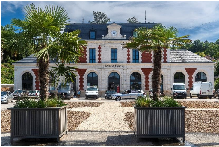
Gare de Figeac