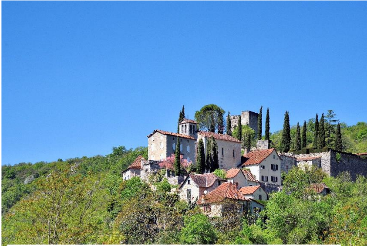
Village de Montbrun – randonnée patrimoine