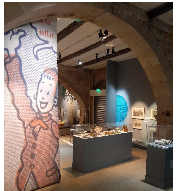
Exposition A la lettre