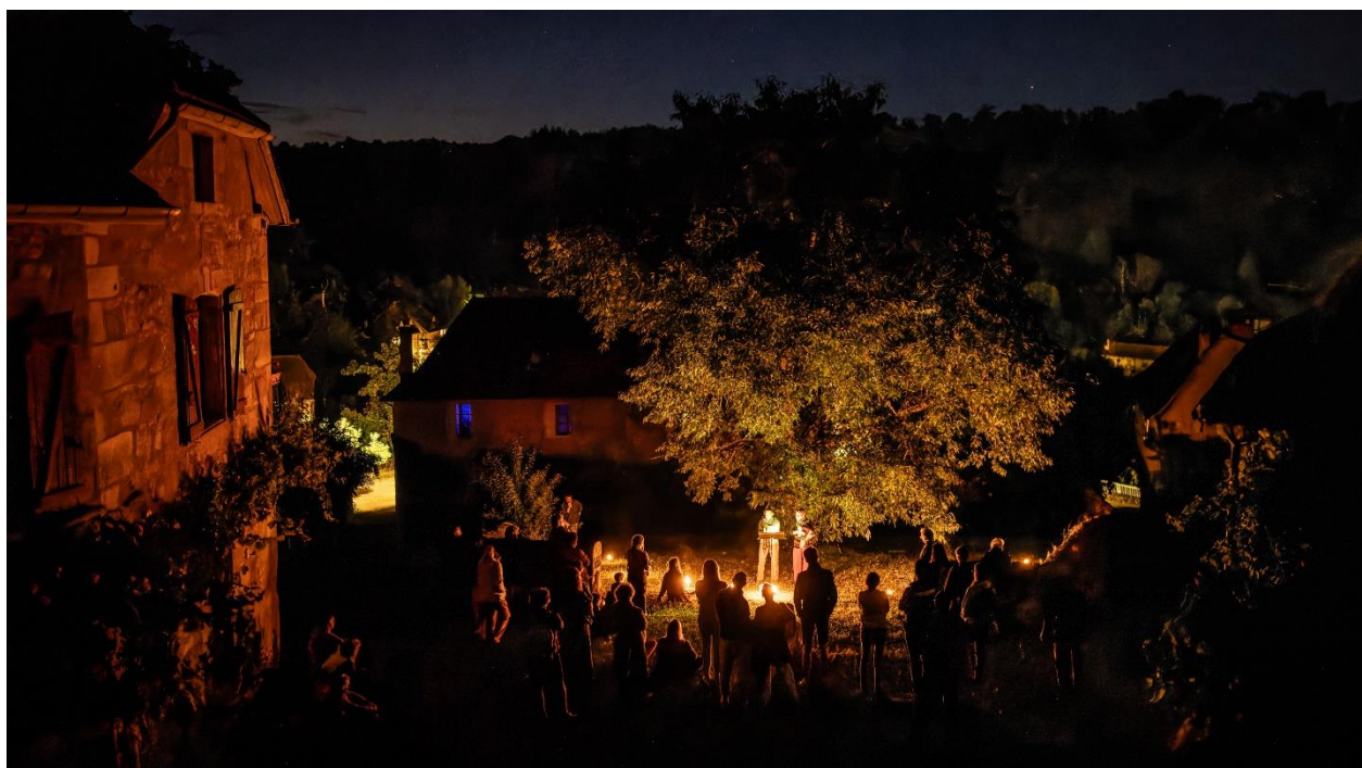
Visite nocturne à Fons

Pays d'art et d'histoire Grand-Figeac, Vallées du Lot et du Célé